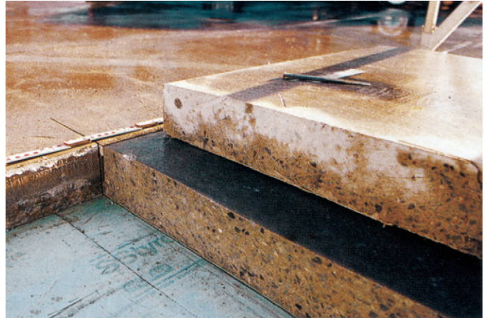
Abb. 3: Aufgeschnittene Ortbetonfahrbelagplatte zur wissenschaftlichen Untersuchung und Bestätigung der langzeitlichen Funktionstauglichkeit der Parkdachkonstruktion

kräfte [7]. Die Ausführung und die Qualität der Fugenabdichtung entscheiden über die dauerhafte Funktionsfähigkeit dieser Sonderkonstruktion.