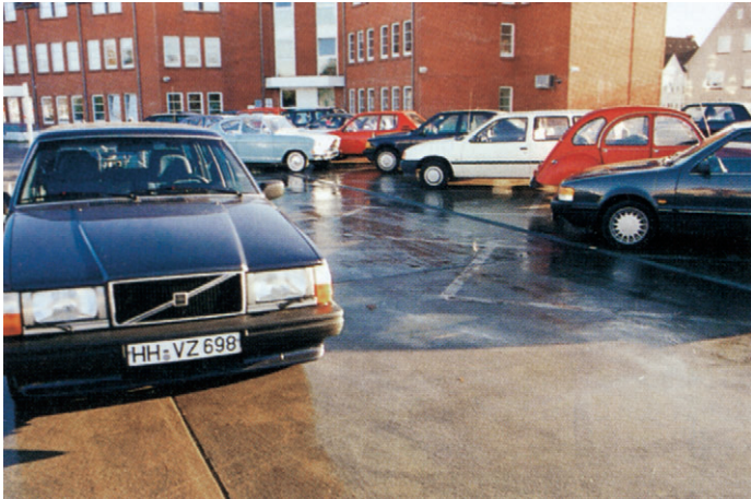
Abb. 2: Parkdach eines Supermarktes in Norddeutschland